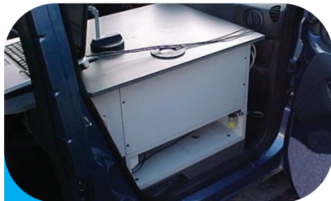
Allestimento su automezzo