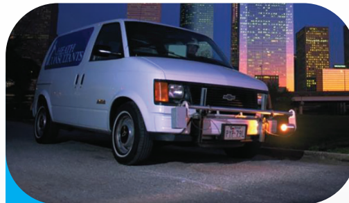
OMD su Automezzo